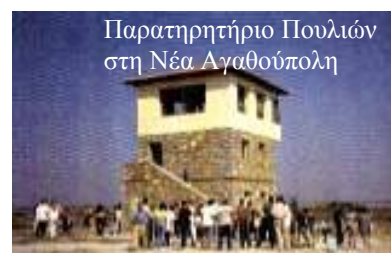
Παρατηρητήριο Πουλίων στη Νέα Αγαθούπολη

Έκδοση ενημερωτικού υλικού (βλέπε φυλλάδιο: παράκτιοι υγρότοποι της Πιερίας).